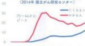
子宮頸がんの10万人あたり人数 (2014年 国立がん研究センター)